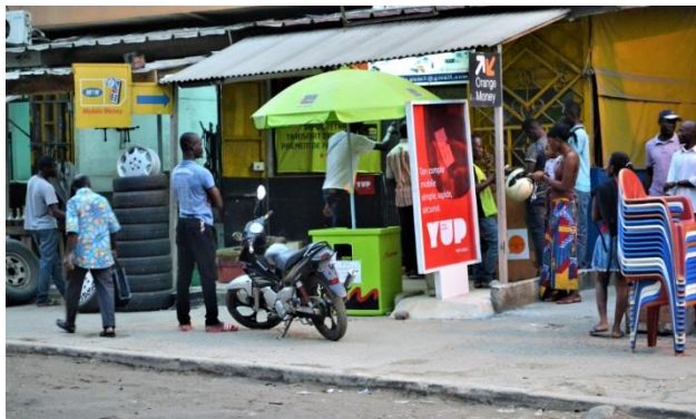
Point de vente YUP en Côte d'Ivoire

Destiné à la clientèle bancarisée et non bancarisée, YUP est accessible à tout détenteur de mobile (smartphone ou téléphone mobile classique) quel que soit son opérateur téléphonique grâce au partenariat conclu avec Tagpay, fintech française dont Société Générale est actionnaire, qui a développé la technologie d'authentification sans contact NSDT, innovante et plus intuitive pour les utilisateurs que les solutions déjà existantes sur le marché. YUP s'appuie sur l'écosystème innovation rassemblé au sein de son Lab Innovation à Dakar, ouvert dans les locaux de Jokkolabs. C'est là que s'écrivent, en