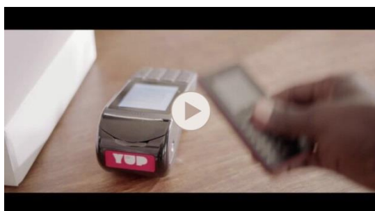
Film publicitaire YUP en Côte d'Ivoire

S'appuyant sur un modèle d' « Agency Banking », c'est-à-dire sur un réseau d'agents tiers avec lesquels la banque a noué des partenariats (stations services, commerce de distribution etc), YUP est ainsi accessible via un réseau élargi de distributeurs équipés de terminaux adaptés et bien sûr par le biais de l'application de mobile banking des différentes banques Société Générale sur le continent. YUP permet notamment à Société Générale de répondre aux besoins d'une clientèle peu touchée jusque-là par l'offre bancaire, en offrant une très grande disponibilité, proximité et facilité d'utilisation.